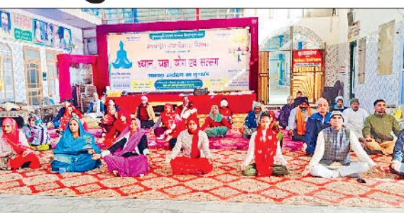
भिवानी। श्री हनुमान जोहड़ी में आयोजित कार्यक्रम में उपस्थित लोग।

ध्यान, यज्ञ, योग एवं सत्संग पखवाड़ा कार्यक्रम का शुभारंभ किया गया। यह कार्यक्रम 21 दिसंबर 2025 तक निरंतर चलेगा। कार्यक्रम का शुभारंभ मंदिर के महंत