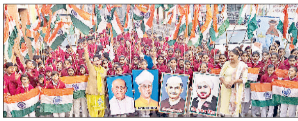
भिवानी। कार्यक्रम में तिरंगे के साथ अपनी प्रस्तुति देते बच्चे।