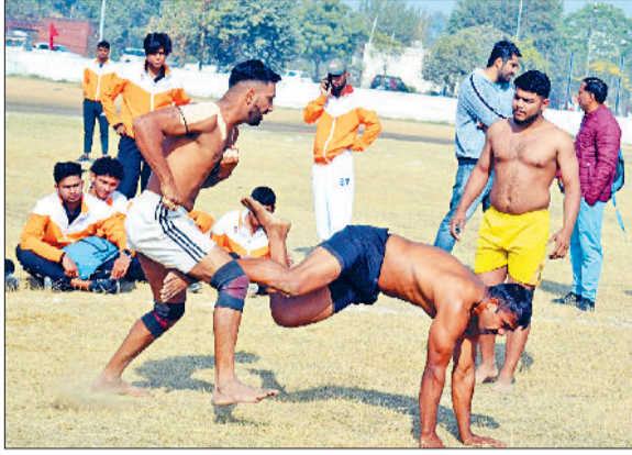
भिवानी। आयोजित कबड्डी मैच में रेडर को पकड़ते हुए।