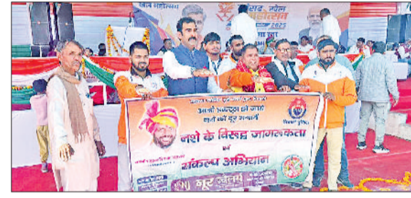
भिवानी। नशे के प्रति जागरूकता की शपथ दिलाते हुए।