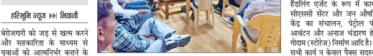
भिवानी। बैठक में समस्याओं को लेकर मंथन करते हुए।

भिवानी में सीएम पैक्स की तीन जिलों की बैठक आयोजित