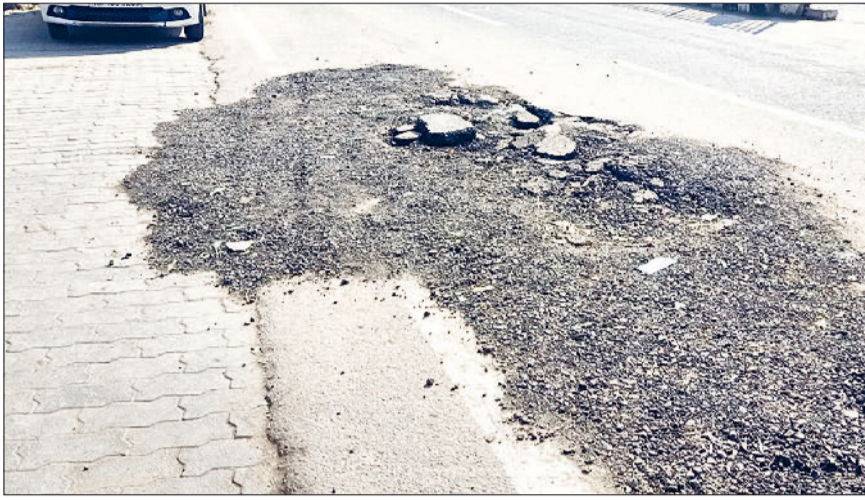
बवानीखेड़ा। सीवरेज के लिए उखाड़ी गई सड़क, जिस वजह से हादसों का बना रहता है डर।

बवानीखेड़ा में सीवरेज व्यवस्था पिछले काफी समय से चरमराई हुई है। सभी 16 वार्डों के लोग इस प्रक्रिया से परेशान हैं। वहीं बात की जाए तो हांसी चुंगी से लेकर नगरिक अस्पताल तक सारे शहर का गंदा पानी सीवरेज के पाइप के ढक्कनों से निकलकर मुख्य मार्ग से होता हुआ लोगों की दुकानों व घरों के आगे जमा हो जाता है, जिससे राहगीरों, दुकानदारों, मकान मालिकों व सभी को परेशानियों का सामना करना पड़ता है।