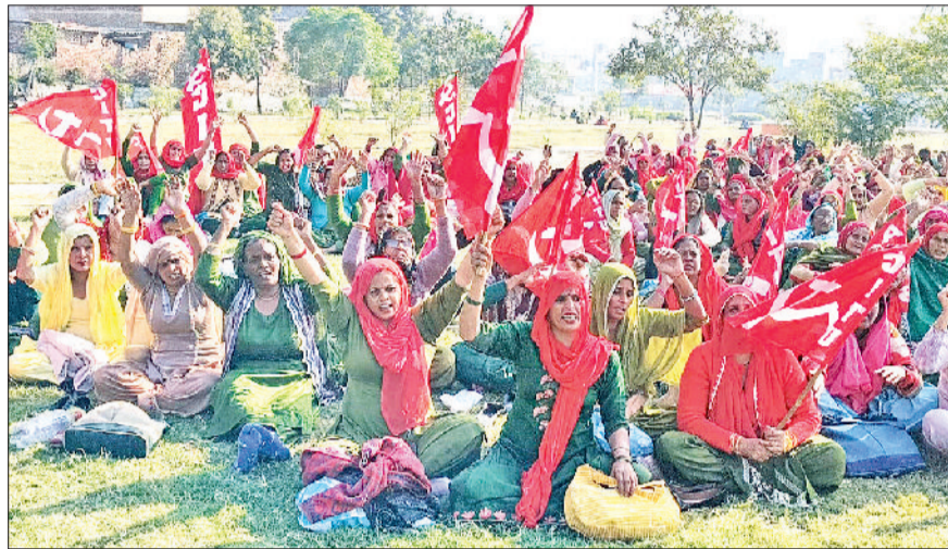
भिवानी। लंबित मांगों को लेकर प्रदर्शन करती महिला वर्कर।

लंबित मांगों को लेकर रविवार को मिड-डे मील वर्कर्स ने जबरदस्त प्रदर्शन किया। शहर में जुलूस निकाला और बाद में सांसद के आवास के बाहर प्रदर्शन किया। इस दौरान महिला प्रदर्शनकारियों ने सरकार के खिलाफ जमकर नारेबाजी की। महिला प्रदर्शनकारियों ने चेतावनी दी कि अगर उनकी मांगों को पूरा नहीं किया गया तो वे अनिश्चितकालीन आंदोलन का बिगुल बजाने से पीछे नहीं हटेंगी। मिड-डे मील वर्कर्स ने पुरान बस अड्डे स्थित टाकुर बीर सिंह पार्क से जुलूस आरंभ किया और महम रोड से होते हुए सांसद धर्मवीर सिंह के आवास पर पहुंचीं। इस दौरान महिला प्रदर्शनकारियों ने सरकार के खिलाफ नारे भी लगाए। इससे पूर्व एकत्रित महिला वर्कर्स को संबोधित करते हुए वक्ताओं ने