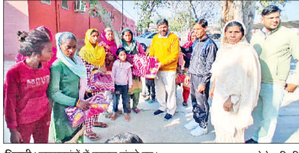
भिवानी। जरूरतमंदों में कंबल बांटे हुए।