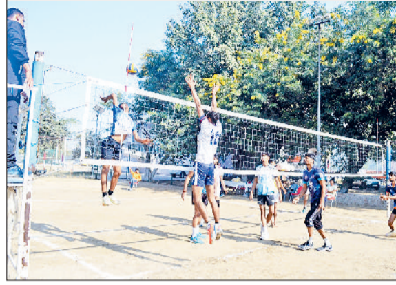
भिवानी। वालीबाल स्पर्धा में शॉट लगाते हुए।

100 मीटर दौड़ में दादरी से स्नेहा पहले स्थान पर रही। सीमा तोशाम दूसरे और भिवानी की नैसी तीसरे स्थान पर रही