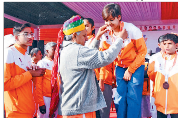
भिवानी। प्रतियोगिता के विजेता प्रतिभागी को सम्मानित करते सांसद।